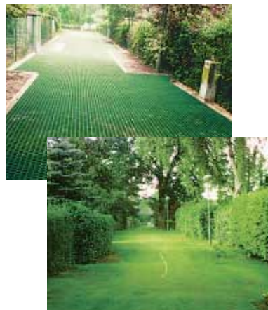
Aplikace po montáži a finální podoba